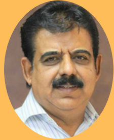
माननीय श्री शंकर लालवानी (सांसद, इंदौर)