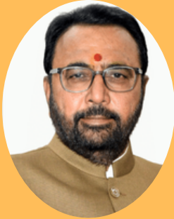
माननीय श्री प्रतापराव जाधव (केंद्रीय आयुष मंत्री भारत सरकार)