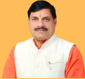
माननीय श्री मोहन यादव (मुख्यमंत्री मध्य प्रदेश शासन)