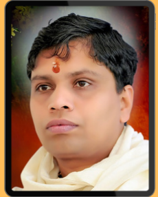
Acharya Balkrishna CEO Patanjali Ayurved Haridwar